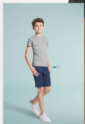
REGENT FIT KIDS 01183