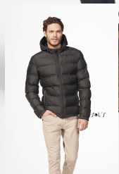
RIDLEY MEN 01622