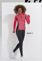
BERLIN WOMEN 01417