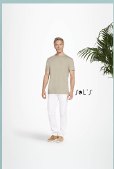
ORGANIC MEN 11980