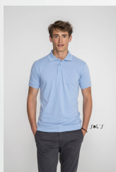
PRIME MEN 00571