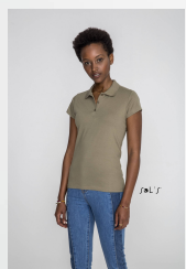
PRESCOTT WOMEN 11376