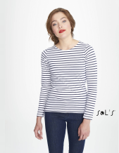
MARINE WOMEN 01403