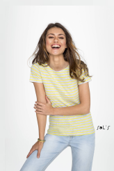
MILES WOMEN 01399