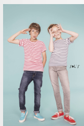
MILES KIDS 01400