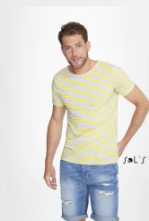
MILES MEN 01398