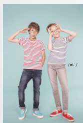
MILES KIDS 01400